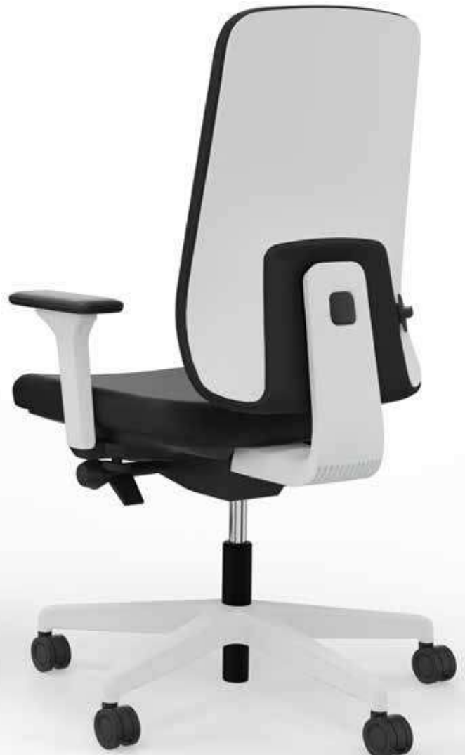
631.2510-001 – weiß