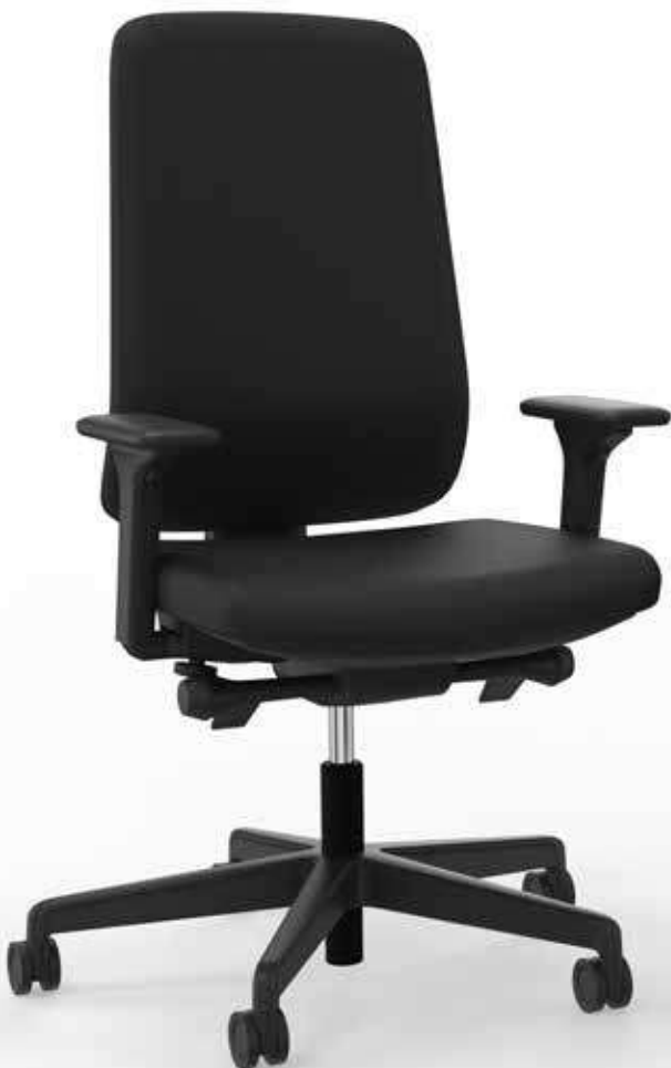
630.2510-001 – schwarz